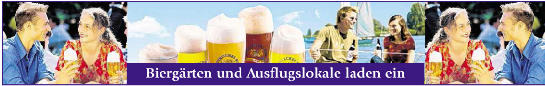
Biergärten und Ausflugslokale laden ein