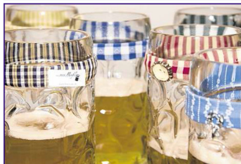
Mit dem Band erkennen Sie Ihren Masskrug sofort wieder. Da macht das Anstoßen doppelt Spaß.

bis G'stanzl, von Dottore bis Glockenspiel. Ein „...mei Mass!“-Band kostet kaum mehr als eine Wiesn-Mass, hält aber wesentlich länger. Die meisten Bänder sind aus Baumwolle gefertigt; sie halten Bierflecken aus und stecken die Handwäsche locker weg. Den nächsten großen Ansturm erwartet das „...mei Mass!“-Team zum Start der Biergarten-Saison.