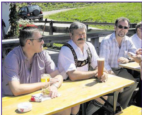
In gemütlicher Runde sitzen, sein Bier oder Schorle genießen – das ist Biergartenatmosphäre pur.